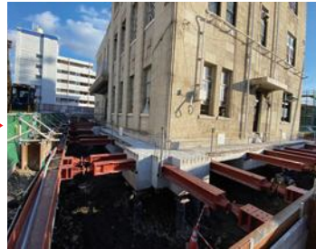
[令和5年12月]基礎下掘削工事

旧館の免震化を行うため、既存の基礎の補強工事、建物を仮に支える杭工事を行い、現在は、基礎下の掘削工事を行っています。今後、免震基礎工事と免震装置を設置する工程に入ります。