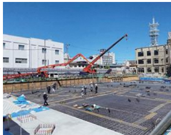
[令和5年8月]基礎コンクリート工事