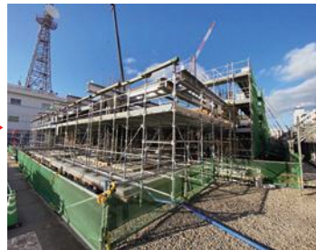
[令和5年12月]1階躯体工事

これまで基礎免震設置工事などを行い、現在は、1階床のコンクリート打設を終え、1階柱梁の配筋や型枠工事を行っています。今後、順次上階の躯体工事を進めていきます。