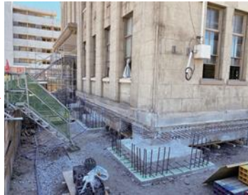
[令和5年8月]既存基礎補強工事